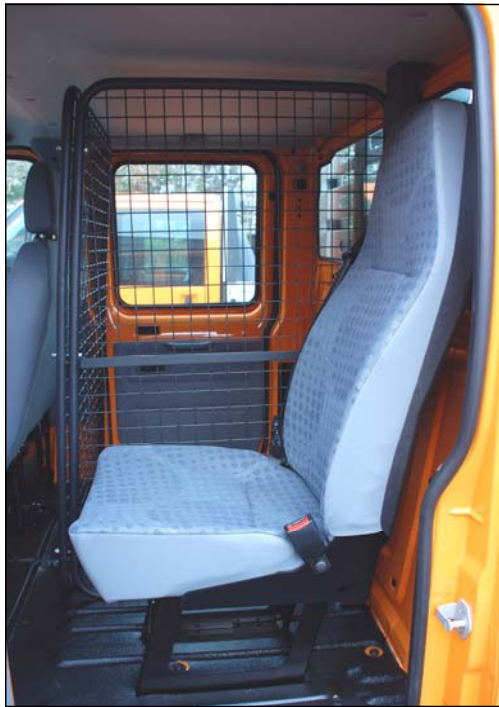
Jany-stol med integreret 3-pkt. sele