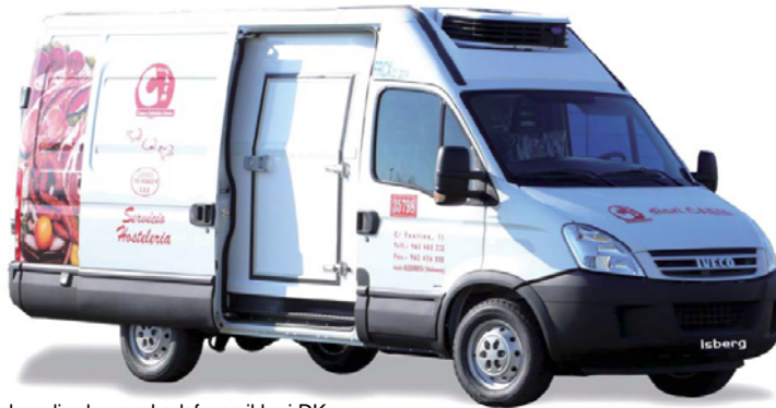
Indvendig dør markedsføres ikke i DK