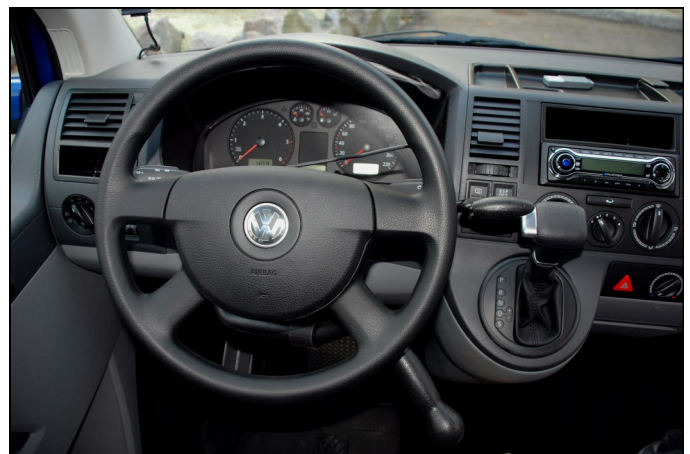
Håndbetjent speeder/bremse og venstrehåndsbetjent afviser