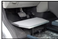
Forhøjet bund og tilpasning af bremsepedal

Ratknop med oplyste el-funktioner er udformet så kontakterne altid sidder korrekt.