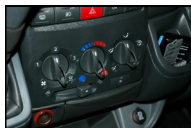
Tilpasning af greb