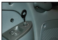
Tilpasning af spejljustering