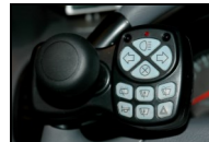
Ratknop m. el-betjente funktioner